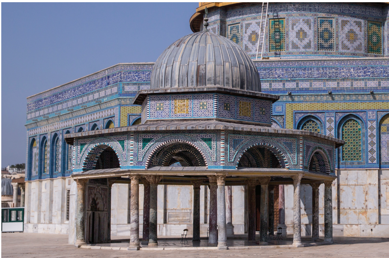
52. Купол Цепи.

Третьим по значению, но, видимо, первым по времени строительства зданием эпохи Омейядов является купол Цепи (Куббат аль-Сильсила) 94 в восточной части возвышенной платформы. Это строение стоит там, где когда-то находились входные двери Храма и ступени, ведущие к этим дверям. Само здание шестиугольное, а у окружающего купол портика одиннадцать