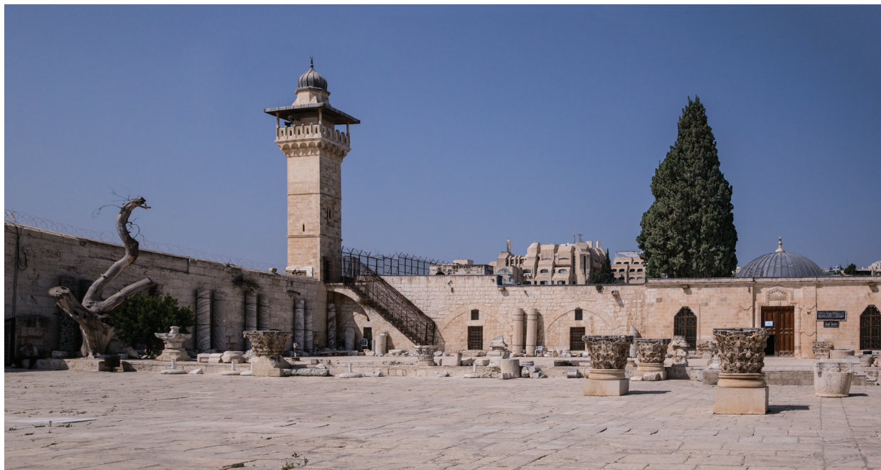
82. Минарет аль-Фахария.

Исключением служит Ибн аль-Мурадджа, который пишет о четырех минбарах (кафедрах для проповедников) – одном на северной и трех на западной стене. А. Каплони предполагает, что это ошибка переписчика и что на самом деле речь идет о минаретах [Kaplony, 2002]. Напрашивается вывод, что четыре минарета существовали еще до крестоносцев, в том же количестве, что и ныне (возможно даже, в тех же местах, что и сейчас), но они не были столь высоки и заметны, как сменившие их мамлюкские минареты.