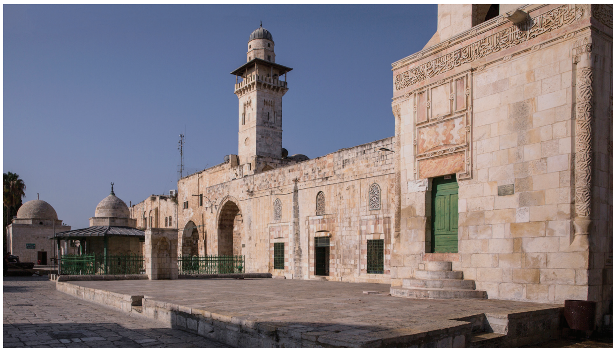
101. Медресе Ашрафия – между минаретом аль-Сильсила сабилем Кейт-бей, который здесь виден частично. На левом краю фотографии видны сабиль Касим-паши и купол Моше.