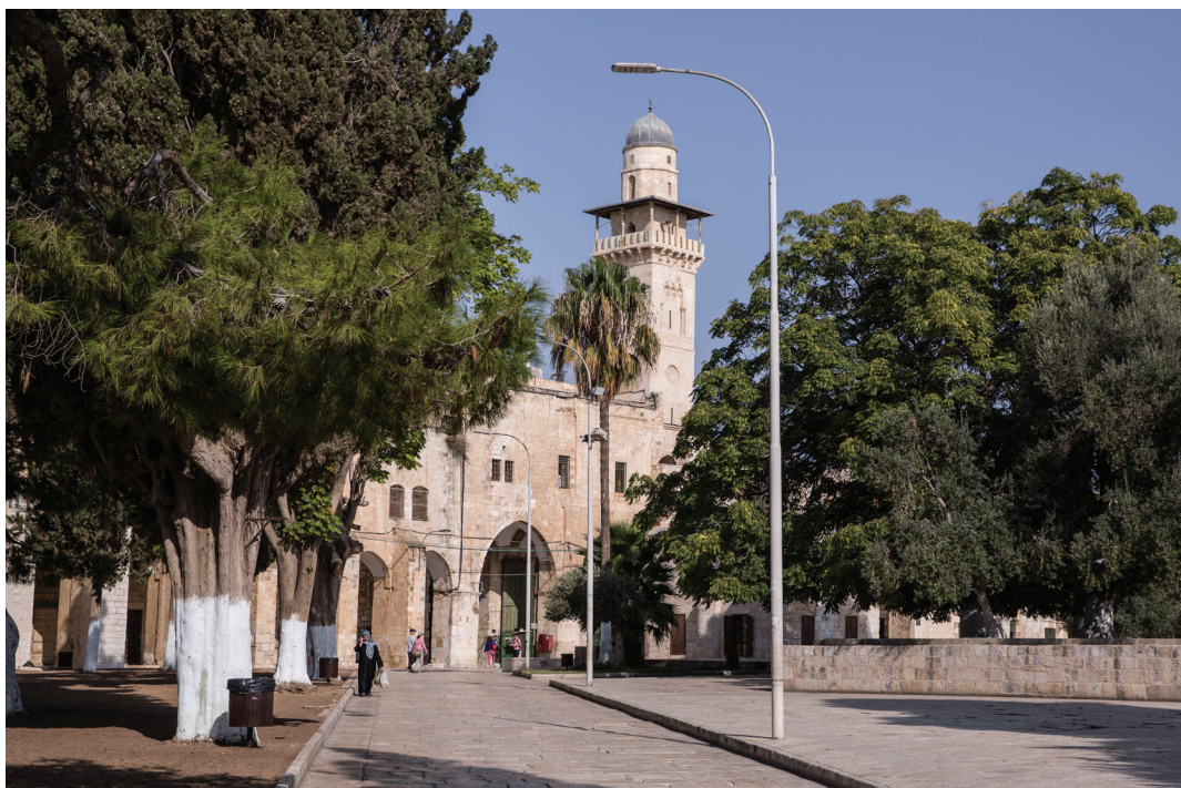
81. Минарет аль-Сильсила.

С третьей стороны, большинство описаний Храмовой горы эпохи до крестоносцев (например, Хосров и Мукадиси ) не упоминают минаретов.