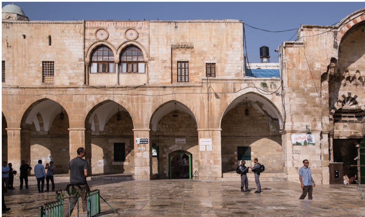
100. Медресе Утмания, под ним – ворота Очищения (айюбидского периода).