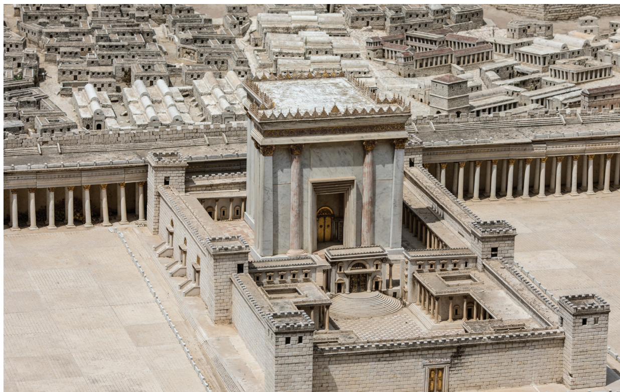
13. Фасад Второго Храма на реконструкции, созданной проф. М. Ави-Йона в 1966 г. (модель находится сейчас в музее Израиля в Иерусалиме). Хорошо виден наружный фасад чертога, с пятью параллельными балками над входом, сквозь вход можно увидеть и внутренний фасад Гейхаля (см. предыдущее фото). Можно увидеть также полукруглые ступени, ведущие к воротам Никанора.