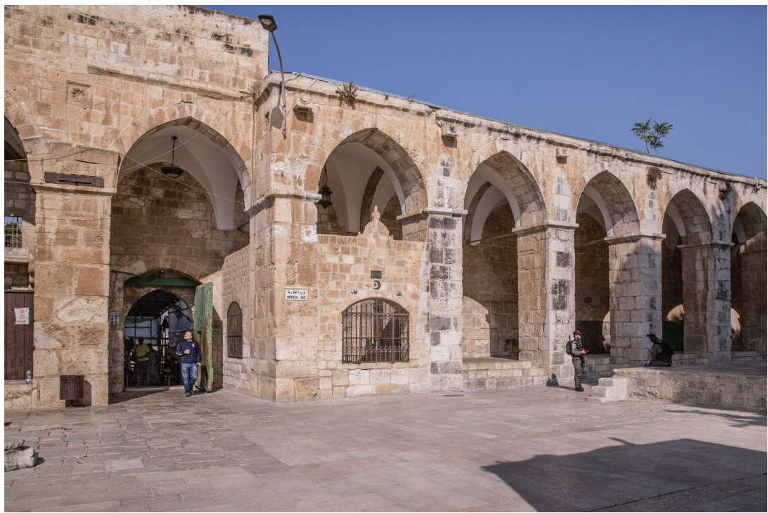
89. Магрибские ворота (вид изнутри).