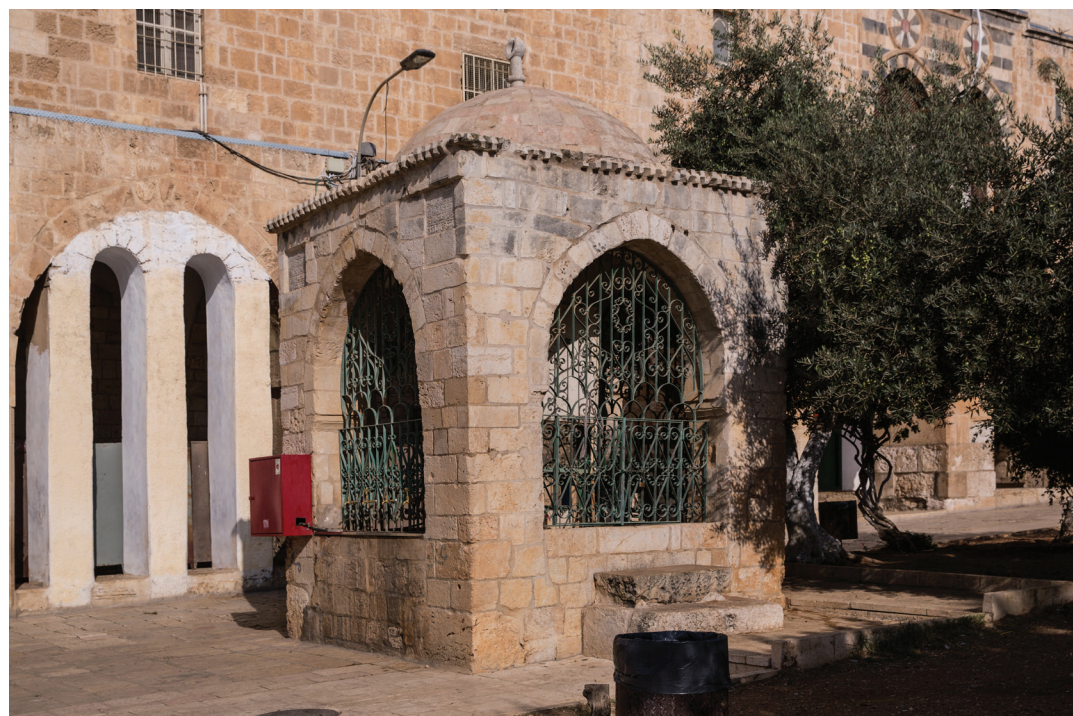
99. Сабиль Ибрагим а-руми.