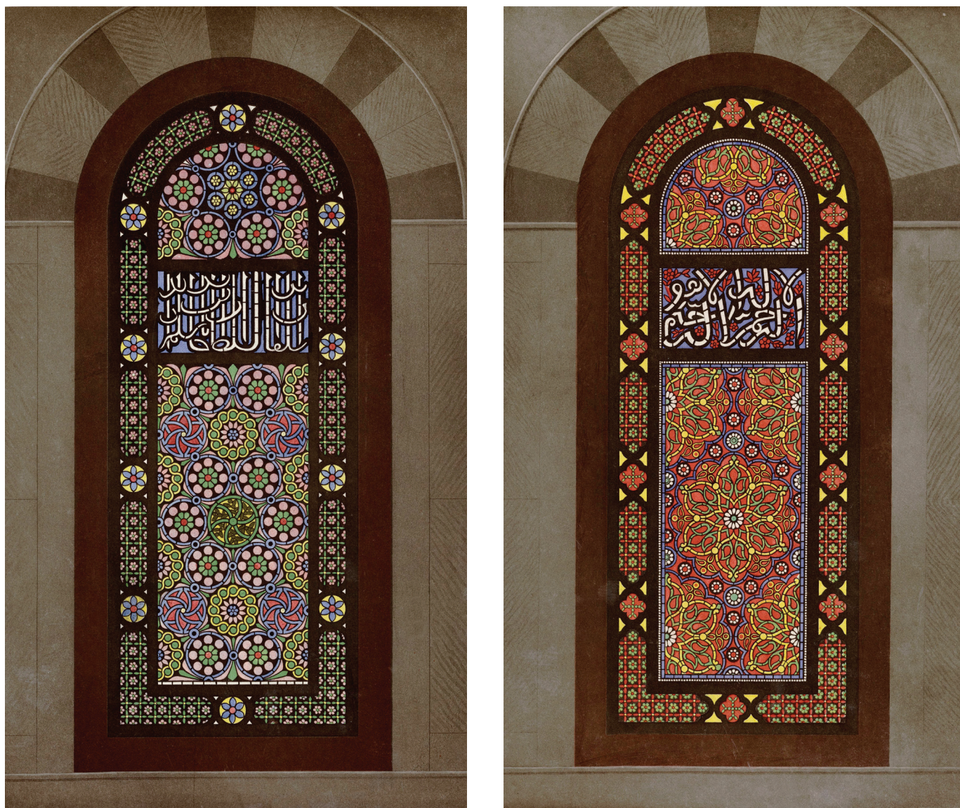
105. Два из витражей в окнах Купола Скалы, относящихся ко времени султана Сулеймана. Из книги М. Вогюэ [Vogüé, 1864].

Однако вначале, в период XVI–XVII вв., османы воздвигли немало зданий на Храмовой горе, и многие из них обладают большими художественными достоинствами. Их можно разделить на три группы: четыре отдельно стоящих купола на возвышенной платформе, большая группа суфийских халв по ее периметру и несколько разрозненных зданий в остальных частях комплекса.