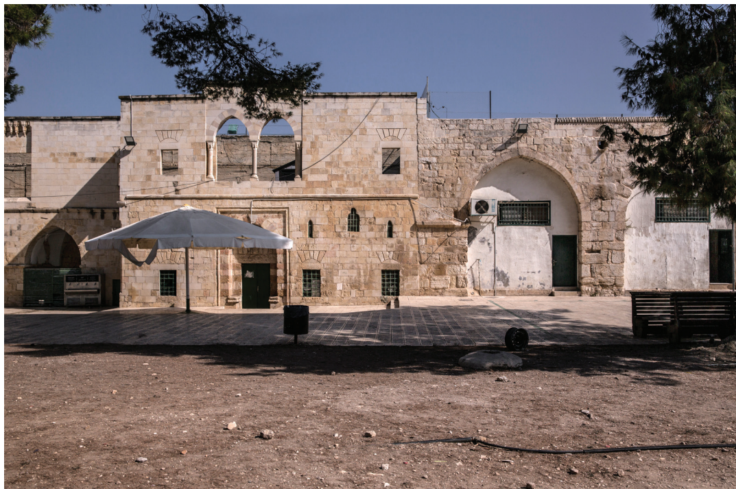
98. Медресе аль-Гадирия.