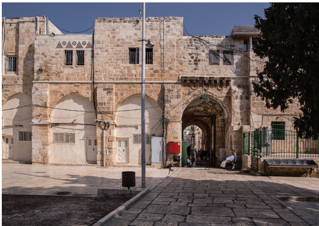
55. Баб Хутта (ворота Прощения).