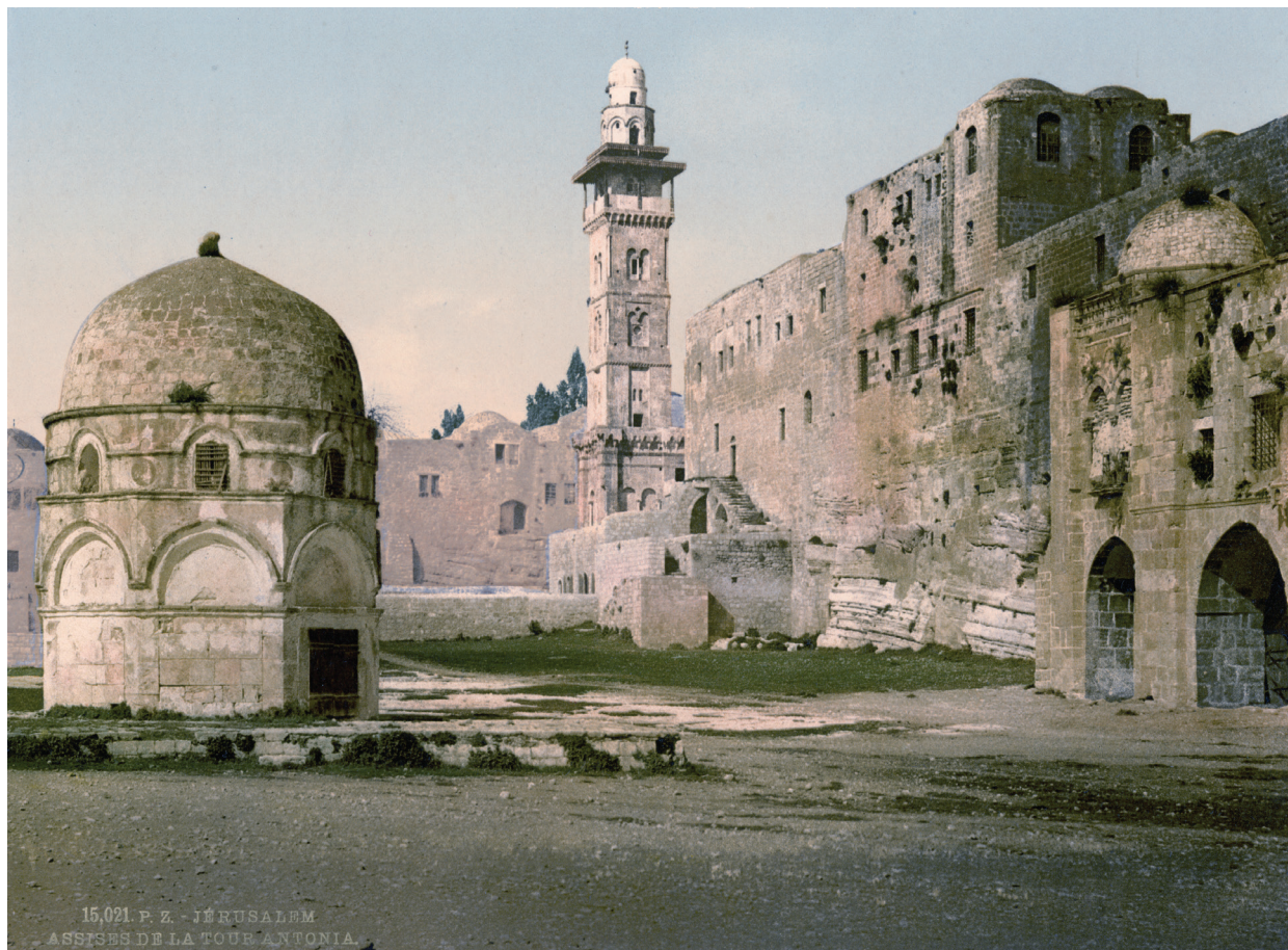
74. Медресе Джавалия на фотохромном отпечатке, сделанном между 1890 и 1900 гг. (Detroit Photographic Company). Цвет отпечатка изменен. До перестройки восточной части здания. Обратите внимание на портик по правому краю фотографии – он еще не заложен, как сейчас. Фото хранится в Библиотеке Конгресса США.

В 1920-е годы здание аль-Субайбия было сильно перестроено, средневековые части остались замурованными в нижнем этаже, а над ними возникли новые школьные классы.