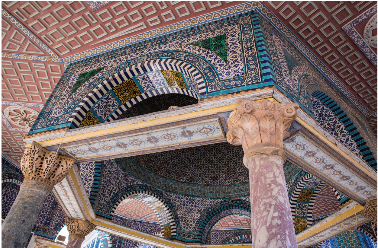
53. Купол Цепи, внутреннее оформление.

сторон и колонн – весьма необычная архитектурная форма. Названием своим Купол обязан арабской легенде, гласящей, что на этом месте вершил суд царь Давид. Согласно легенде, на суде Давид пользовался волшебной цепью, которая помогала ему установить истину 97 . Более поздние средневековые мусульманские писатели утверждают, что это здание служило моделью при строительстве Купола Скалы. Так, например, пишет Муджир ад-Дин [ Le Strange , 1890]. Однако принципиально разная форма этих двух зданий делает это утверждение нелепым.