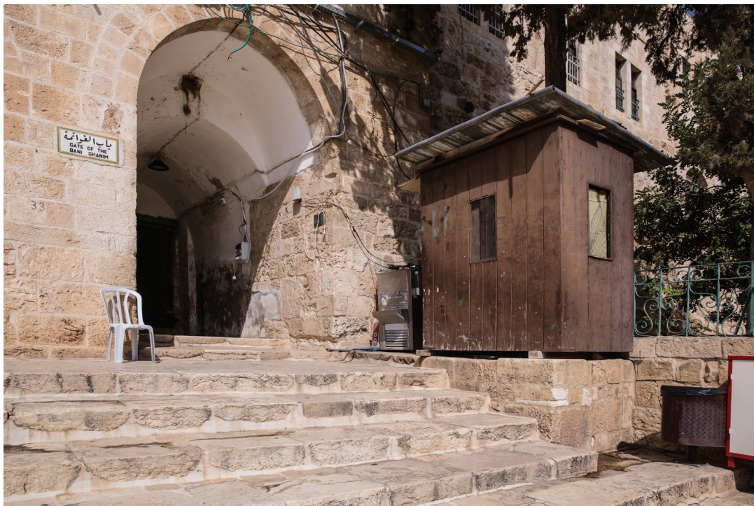
88. Ворота эль-Гунима (вид изнутри).