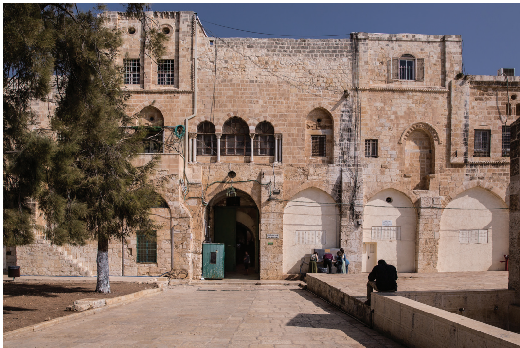
54. Темные ворота.